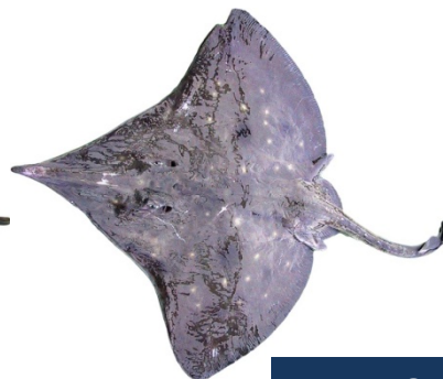
RJO - Dipturus oxyrinchus