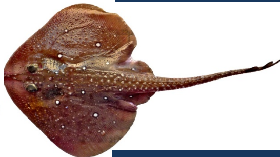
RJI - Raja circularis