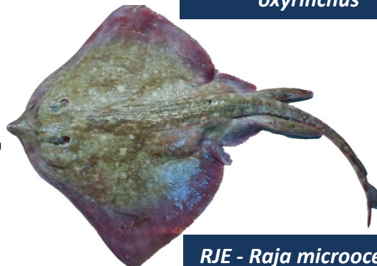
RJE - Raja microocellata