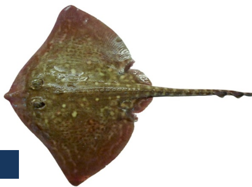
RJC - Raja clavata