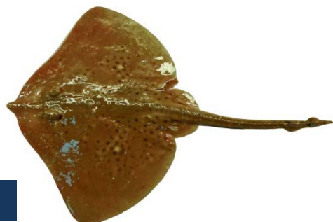
RJM - Raja montagui