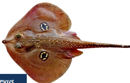
RJN - Leucoraja naevus