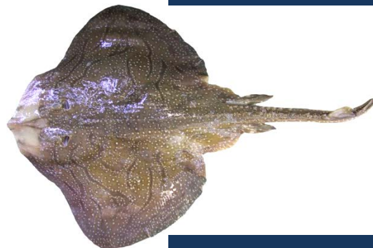
RJU - Raja undulata