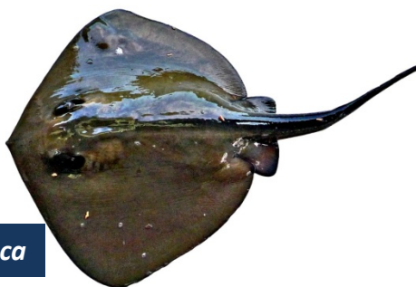
JDP - Dasyatis pastinaca