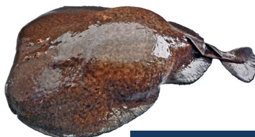
TTR - Torpedo marmorata