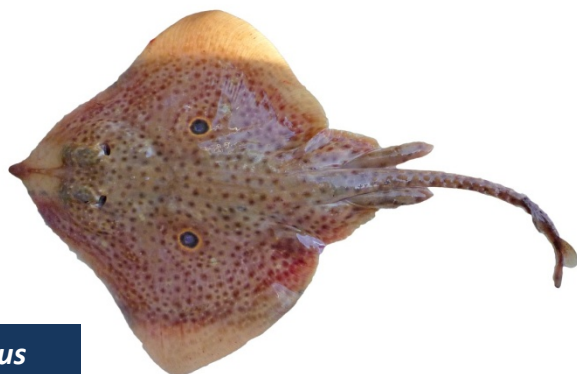
JAI - Raja miraletus